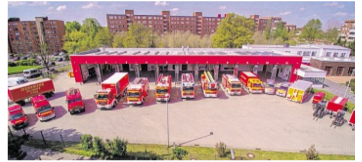
Die Flotte der Glinder Feuerwehr aus der Sicht einer Drohne.

Die Glinder Feuerwehr zur Corona-Pandemie