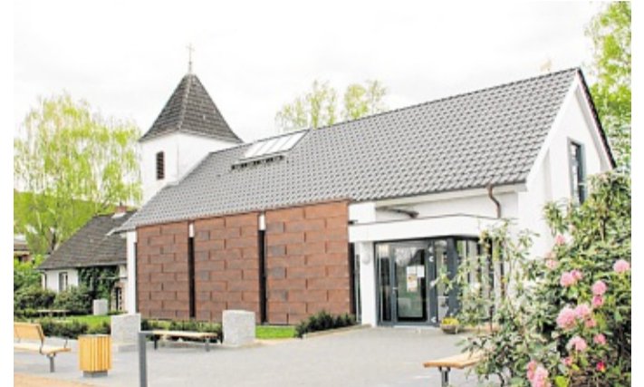
Die Kirche der Gemeinde „Zu den heiligen Engeln“ in der Möllner Landstraße.

Wie schwierig es für die Wirtschaft und den Handel aussieht, deren Existenzen unmittelbar bedroht waren und aktuell noch immer sind, das bedarf keiner großen Phantasie. Und wir als Kirche 'mitten unter den Menschen' solidarisieren uns gerne und ausdrücklich mit den lokalen Geschäften und Betrieben, die die MARKT-Zeitung jetzt unterstützt. Wir bitten alle Bürger der Region, insbesondere auch unsere Kirchenmitglieder, hier solidarisch zu handeln: „Hier leb' ich, hier